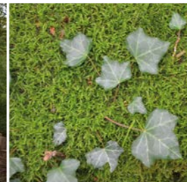
Efeu und Moos