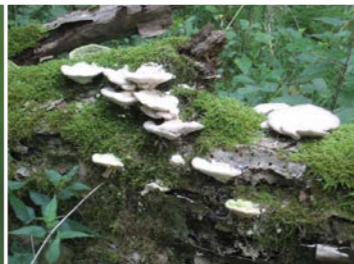
Abgestorbener Baum im natürlichen Kreislauf