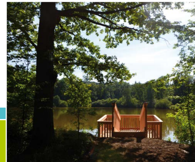
Die Plattform auf dem Großen Wolfsee lädt zum Verweilen, zum Beobachten und zum Entdecken ein