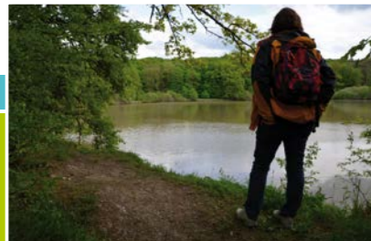
Wanderin am Wolfsee