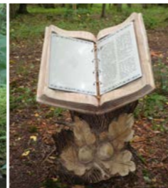
Geschichten aus dem Wald